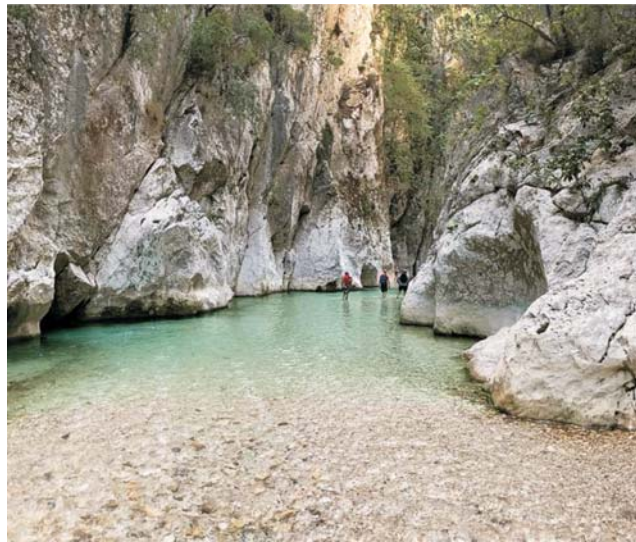
Die klaren Flüsse und Bäche des Epirus bieten immer wieder Gelegenheit zu einem erfrischenden Bad. Hier bei einer kleinen Flußwanderung am Acheron

dieser Folder wurde CO 2 - neutral hergestellt