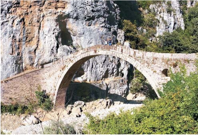
typische historische Steinbrücke im Epirus: Kokkoris-Brücke über den Vikos