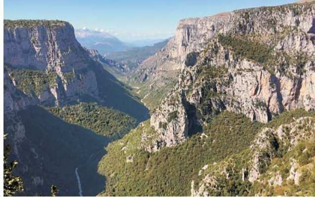
Blick vom Aussichtspunkt Beloi in die hier fast 1000 m tiefe Vikos-Schlucht

Wer gerne in mediterraner Natur wandert und gleichzeitig ein ansprechendes Kulturprogramm genießen möchte, für den ist diese Exkursion genau richtig. Die FAZ beschrieb vor einigen Jahren unser Exkursionsgebiet im Epirus, die Zagorachoria, nicht weit von der albanischen Grenze, als das „bestgehütete Geheimnis Griechenlands“. Und in der Tat, es handelt sich um die am dünnsten besiedelte Region ganz Griechenlands in einer geradezu arkadisch schönen Landschaft. Unterkunft nehmen wir ganz authentisch in einem der steinernen Bergdörfer in ca. 1100 m Höhe. In dieser ursprünglichen Umgebung essen und trinken wir was die herrliche Landschaft hergibt. Ein kulinarischer Genuß!