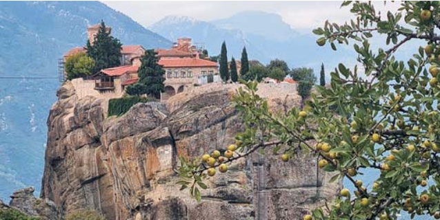
zu dramatischer Schönheit vereinigen sich Klöster und Landschaft Meteoras

Nach der Anmeldung zu dieser Reise wird mit der von GEOPULS zugesandten Buchungsbestätigung eine Anzahlung (15% des Reisepreises) fällig. Die Restzahlung erfolgt zwei Wochen vor Reisebeginn. Es gelten die Geschäftsbedingungen des Veranstalters: Geopuls GbR, Neckarhalde 62, 72108 Rottenburg. Bitte beachten Sie vor Reisebuchung unsere Allgemeinen Reisebedingungen sowie das Formblatt zur Unterrichtung des Reisenden bei einer Pauschalreise nach § 651a des BGB (EU-Richtlinie 2015/2302). Beides schicken wir gerne vor Buchung zu oder kann auf unserer Homepage eingesehen werden. www.geopuls.de