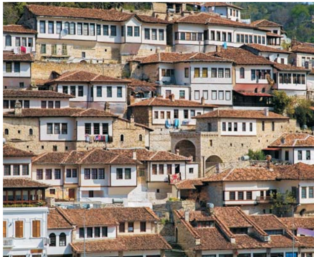
eng an die Felsen geschmiegte Altstadt von Berat

Nach langer Abgeschlossenheit wird die Region vom internationalen Tourismus erst heute so langsam entdeckt und blieb bislang von einem Massenansturm noch verschont. Großartige Landschaften mit einer nahezu unberührten Natur in den Albanischen Alpen, lange Sandstrände an der Adria und eine abwechslungsreiche Geschichte bis zurück in die Antike - Albanien hat dem Reisenden viel zu bieten. Auf unserer Route warten allein 5 UNESCO-Welterbestätten (und 3 Anwärter darauf) auf Ihren Besuch. Mit einem albanischen Geographen, der seine Heimat bis in den abgelegensten Winkel kennt, hervorragendes Deutsch spricht und humorvoll die Eigenheiten der Region vermittelt, wird diese Reise zu einem ganz besonderen Erlebnis. Mit einer kleinen Gruppe von max. 16 Teilnehmern gastieren Sie in hochwertigen Hotels sowie Landgasthöfen und genießen die ausgezeichnete lokale Küche. Sehr schnell wird Sie die herzliche Gastfreundschaft und lebensfrohe Art der Albaner begeistern und eventuelle Vorurteile als vollkommen unberechtigt verpuffen lassen. Die gesamte Region gilt heute als äußerst sicher. Die Route führt von der farbenprächtigen Hauptstadt Tirana über Krujë und Shkodra nach Montenegro, in den Biogradska Gora Nationalpark sowie über Peja und Prizren in die Albanischen Alpen. In Südalbanien führt die Route nach Berat, entlang der Adria bis nach Butrint sowie über Gjirokastra nach Ohrid in Nordmazedonien. Ihren Abschluss findet die abwechslungsreiche Reise in der Hafenstadt Durrës an der Adria.