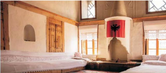
Wohnraum in einem traditionellen Bürgerhaus in Gjirokastra

* Aufpreis zum Flug im Mai: 140,- € (Hauptsaison) max. Teilnehmerzahl: 16 Personen