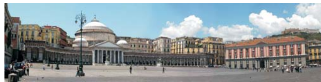
Neapel - Piazza Plebiscito (auch Titelbild)

dieser Folder wurde CO 2 - neutral hergestellt