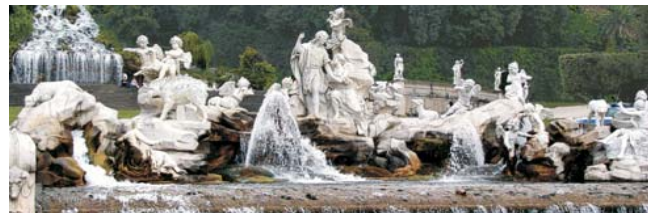
Venus & Adonis Brunnen im Schloßpark der Reggia von Caserta

GEOPULS als Spezialreiseveranstalter wurde 2004 von Dozenten des Geographischen Instituts der Uni Tübingen gegründet. Begeisterte Geographen und Landeskundler, die Natur, Kultur und Hintergründe eines Ziellandes bestens kennen, führen Sie bei diesen Reisen. Ein Land wird dabei geographisch möglichst umfassend bereist. Das bedeutet, dass neben den berühmten Sehenswürdigkeiten auch die Landesnatur mit seiner Vegetation, Landschaftsformen, etc. Beachtung und Erläuterung finden. Kleine Wanderungen und Spaziergänge in die Natur bieten deshalb immer wieder eine willkommene Abwechslung zum kulturellen Besichtigungsprogramm. Nicht zu letzt gilt es auch, ein Land so authentisch wie möglich zu erfahren. Dies funktioniert am besten in einer noch überschaubaren Gruppengröße, weshalb die max. Teilnehmerzahl je nach Reise auf 11-16 Personen begrenzt ist.