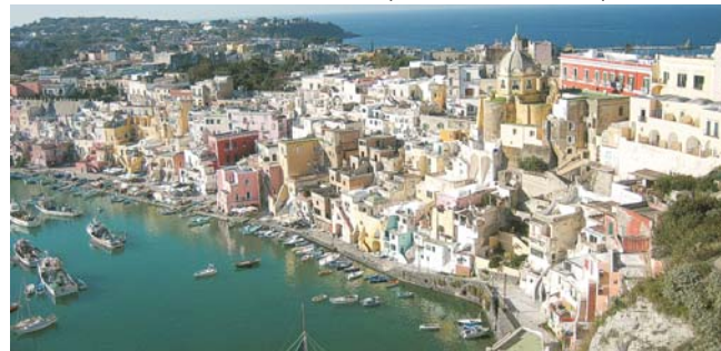
Marina di Corricella auf dem Inselchen Procida im Golf von Neapel

GEOPULS als Spezialreiseveranstalter wurde 2004 von Dozenten des Geographischen Instituts der Uni Tübingen gegründet. Begeisterte Geographen und Landeskundler, die Natur, Kultur und Hintergründe eines Ziellandes bestens kennen, führen Sie bei diesen Reisen. Ein Land wird dabei geographisch möglichst umfassend bereist. Das bedeutet, dass neben den berühmten Sehenswürdigkeiten auch die Landesnatur mit seiner Vegetation, Landschaftsformen, etc. Beachtung und Erläuterung finden. Kleine Wanderungen und Spaziergänge in die Natur bieten deshalb immer wieder eine willkommene Abwechslung zum kulturellen Besichtigungsprogramm. Nicht zu letzt gilt es auch, ein Land so authentisch wie möglich zu erfahren. Dies funktioniert am besten in einer noch überschaubaren Gruppengröße, weshalb die max. Teilnehmerzahl je nach Reise auf 11-16 Personen begrenzt ist.