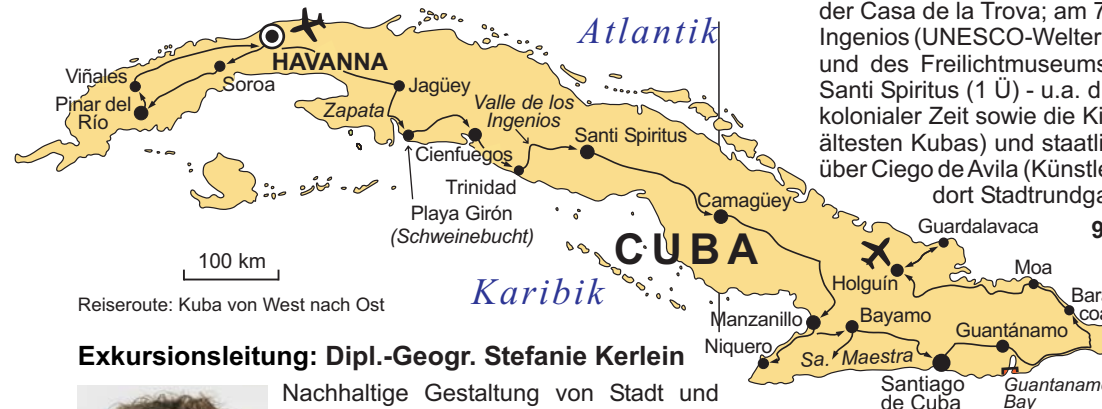
Reiseroute: Kuba von West nach Ost

GEOPULS als Reiseveranstalter wurde 2004 von Dozenten des Geographischen Instituts in Tübingen gegründet und arbeitet seitdem mit ausgewählten Volkshochschulen zusammen. Begeisterte Geographen, die ein Land durch Ihre Arbeit während vieler Aufenthalte von allen Seiten kennen gelernt haben, führen Sie durch Kultur und Natur des jeweiligen Reisezieles. Bei einer Reise mit Geographen gibt es, neben den touristischen Höhepunkten, immer noch etwas mehr zu sehen und zu erleben. Wenig Bekanntes, tiefe Einblicke, das Erkennen von Zusammenhängen in Kultur- und Naturraum, Hintergründiges. Ausflüge in die Natur mit der einen oder anderen kleinen Wanderung gehören dazu, um auch die landschaftlichen Besonderheiten und deren Schönheit kennenzulernen und zu genießen. Die Teilnehmerzahl ist je nach Reise auf angenehme 12 bis max. 16 Personen beschränkt, was auch noch ein Reisen abseits massentouristischer Strukturen ermöglicht.