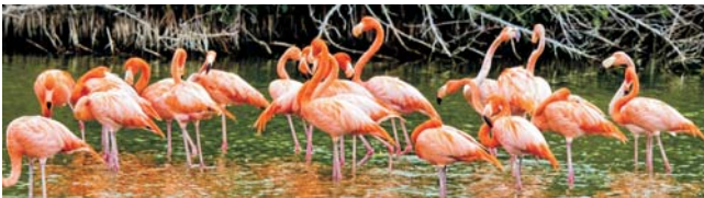
Flaminos in der Mangrove (Zapata-Halbinsel)

Nach der Anmeldung zu dieser Exkursion wird mit der von GEOPULS zugesandten Buchungsbestätigung eine Anzahlung (15 % des Reisepreises) fällig. Die Restzahlung erfolgt zwei Wochen vor Reisebeginn. Es gelten die Geschäftsbedingungen des Veranstalters: Geopuls GbR, Neckarhalde 62, 72108 Rottenburg (Tel. 07472-9808802). Bitte beachten Sie vor Reisebuchung unsere Allgemeinen Reisebedingungen sowie das Formblatt zur Unterrichtung des Reisenden bei einer Pauschalreise nach § 651a des BGB (EU-Richtlinie 2015/2302). Beides schicken wir vor Buchung gerne zu, oder kann auf/von der Webseite www.geopuls.de eingesehen und ausgedruckt werden.