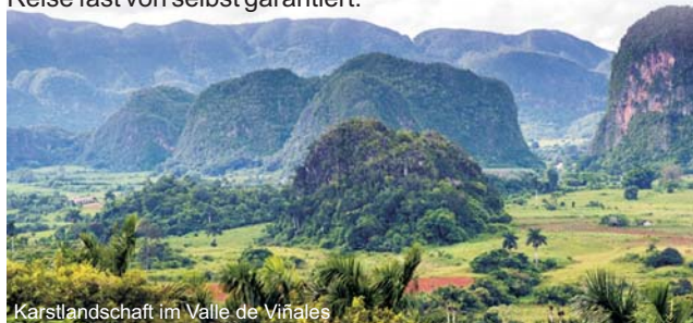
Karstlandschaft im Valle de Viñales