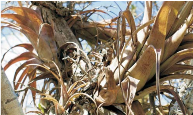
Ähnlichkeit der Formen: Bromelien und Tilantien in der einzigartigen Natur ...