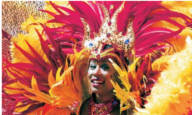
... sowie Karneval in Havanna / Kuba