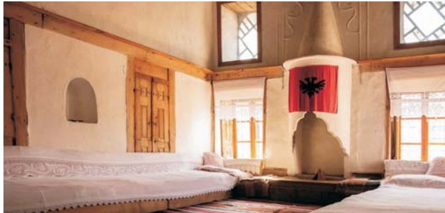
Wohnraum in einem traditionellen Bürgerhaus in Gjirokastra

Nach der Anmeldung zu dieser Exkursion wird mit der von GEOPULS zugesandten Buchungsbestätigung eine Anzahlung (15 % des Reisepreises) fällig. Die Restzahlung erfolgt zwei Wochen vor Reisebeginn. Es gelten die Geschäftsbedingungen des Veranstalters: Geopuls GbR, Neckarhalde 62, 72108 Rottenburg (Tel. 07472-9808802). Bitte beachten Sie vor Reisebuchung unsere Allgemeinen Reisebedingungen sowie das Formblatt zur Unterrichtung des Reisenden bei einer Pauschalreise nach § 651a des BGB (EU-Richtlinie 2015/2302). Beides schicken wir vor Buchung gerne zu, oder kann auf/von der Webseite www.geopuls.de eingesehen und ausgedruckt werden.